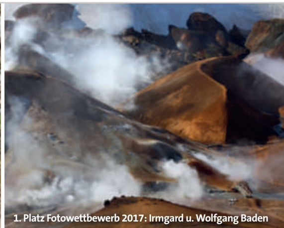
1. Platz Fotowettbewerb 2017: Irmgard u. Wolfgang Baden