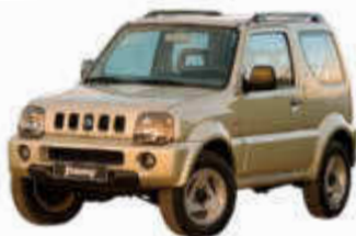
F/Suzuki Jimny o.ä.