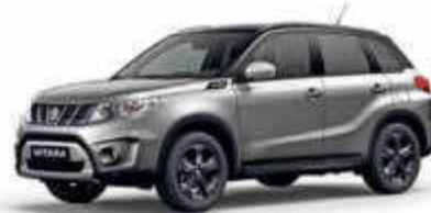
P/Suzuki Vitara o.ä.