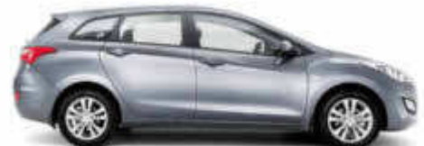
E+C/Hyundai i30 Station o.ä.