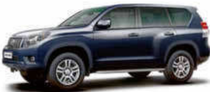
K/Toyota Landcruiser o.ä.