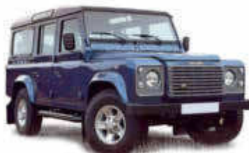
XP/Landrover Defender o.ä.