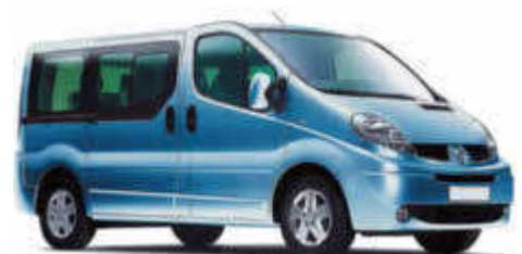
XE/Renault Traffic o.ä.