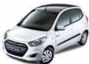
A/Hyundai i10 o.ä.