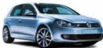
B/VW Golf o.ä.