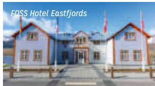
FOSS Hotel Eastfjords