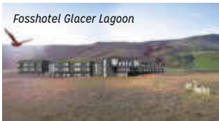
Fossotel Glacier Lagoon